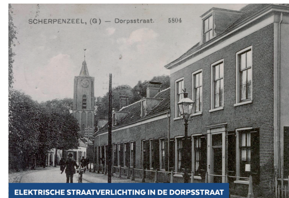
ELEKTRISCHE STRAATVERLICHTING IN DE DORPSSTRAAT