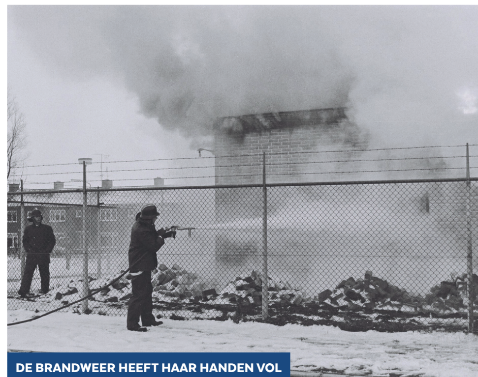
DE BRANDWEER HEEFT HAAR HANDEN VOL

is de officiële ingebruikname als de burgemeester 's avonds de handel overhaalt. Voor de gelegenheid is o.a. de gracht voor Huis Scherpenzeel verlicht. Het transformatorhuisje bij de Grote Kerk (dat er nog ook nu nog staat) is versierd met verlichte reclameletters van de elektriciteitsmaatschappij. Op 'hoofdpunten der straatwegen' zoals het Oosteinde, bij de ingang van de Grootsteeg (Burg. Royaardslaan), de Smissteeg en de Holevoet branden lichtpunten. Tweehonderdveertig huizen en gebouwen in Scherpenzeel zijn op het lichtnet aangesloten. De Scherpenzeelers wandelen die avond door de felverlichte Dorpsstraat. De schitterende lichtreclames in de etalages van de winkels die voor de gelegenheid gratis door de elektriciteitsmaatschappij zijn aangebracht nodigen uit tot een bezoek, wat iedereen dan ook doet. De Dorpsstraat heeft het aanzien van een stad, aldus veel Scherpenzeelers.