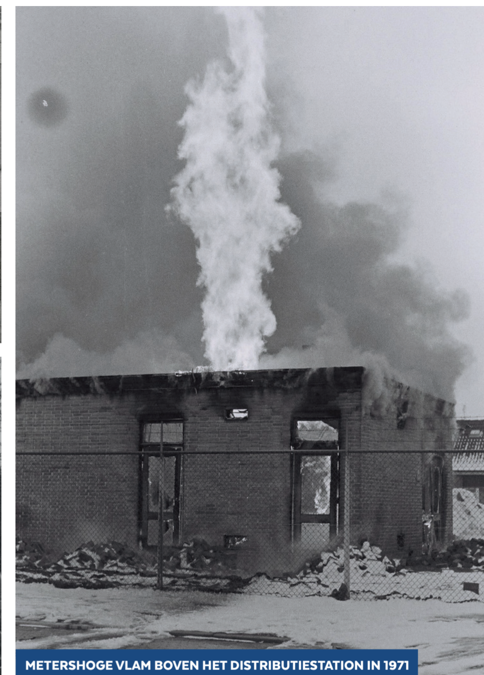
METERSHOGE VLAM BOVEN HET DISTRIBUTIESTATION IN 1971