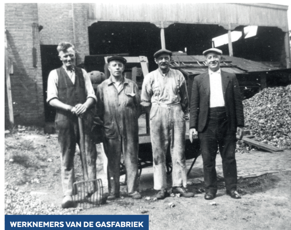
WERKNEMERS VAN DE GASFABRIEK