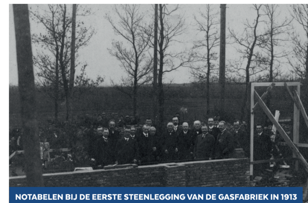
NOTABELEN BIJ DE EERSTE STEENLEGGING VAN DE GASFABRIEK IN 1913